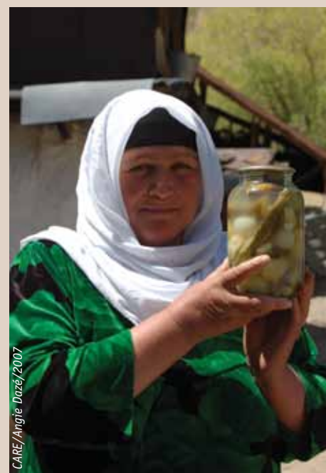
Une femme du village de Panhok au Tadjikistan central, porte un bocal de légumes conservés pour fournir une alimentation variée durant la longue période hivernale.

CARE remercie l'Agence Canadienne de Développement International (ACDI) pour son soutien au projet d'Adaptation au Changement Climatique au Tadjikistan (ACCT).