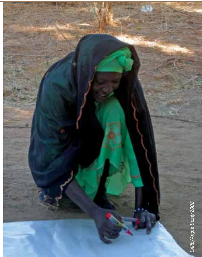
Un groupe de femmes dans le village de Soudoure au Niger, travaille collectivement pour dessiner une carte des risques de leur communauté.